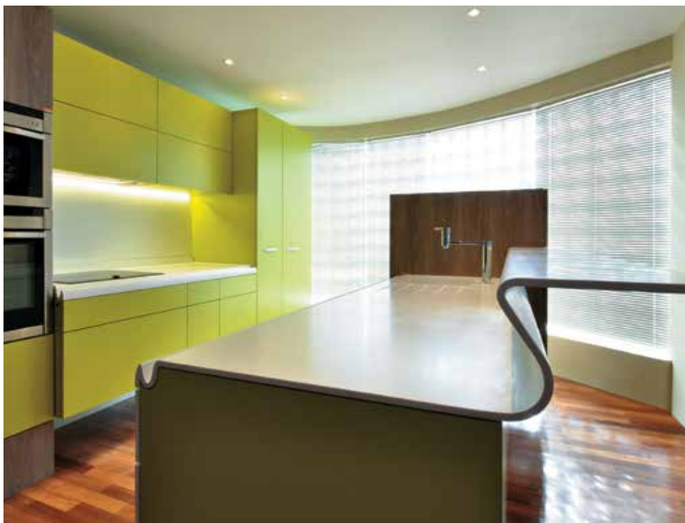
Cozinha "Multi-générationelle" por Arche du Bois; foto: Julien Sol.