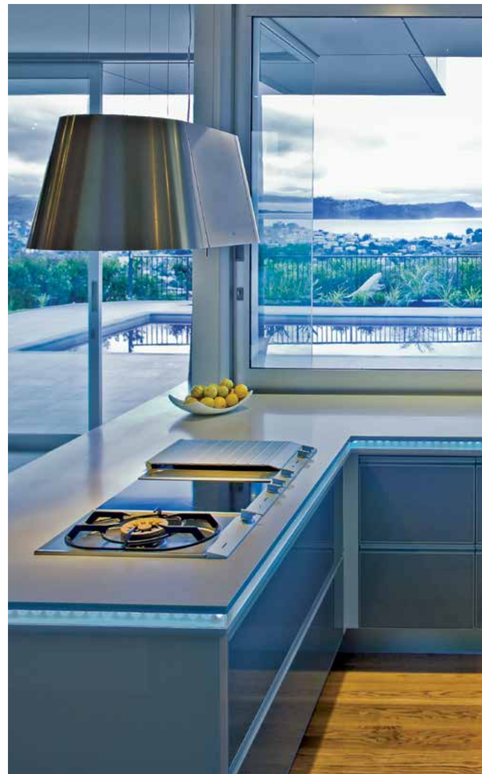
Cozinha em apartamento particular, Nova Zelândia; design: Mal Corboy; foto: cortesia de Mal Corboy Design Ltd.

Corian® tem características únicas: pode ser cortado, colado, usinado e moldado, o que proporciona criar superfícies sem emendas perceptíveis. Inerte, não tóxico e com matéria-prima reciclada em parte da composição, é manufaturado segundo rígidos princípios ambientais, não contaminando água, ar ou solo. Maciço e sem porosidade, com cor uniforme em toda a sua espessura, Corian® não descasca, não amassa, não mancha, é 100% higiênico e dificilmente quebra; em caso de danos, pode ser recuperado, voltando a ser como novo.