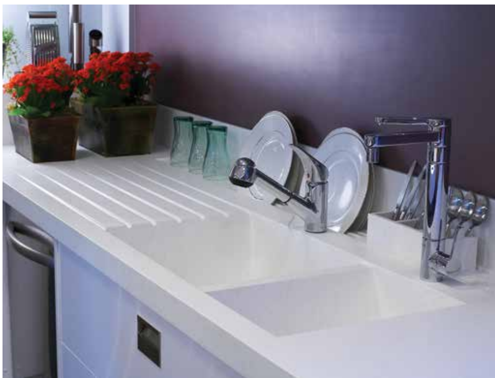
Cozinha e Copa; design: Mauricio Christen; foto: Lauro Maeda.