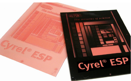
DuPont™ Cyrel® EASY ESP

Chapa de ponto plano digital com superfície modificada